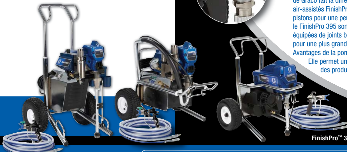
FinishPro™ 395 - FinishPro™ 390 - FinishPro™ 290